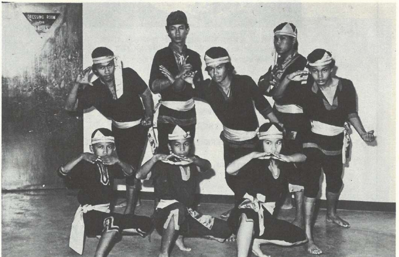
Aksi: Sembah Salam dan hormat.