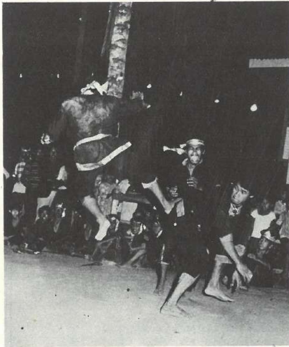
Aksi Seni Silat