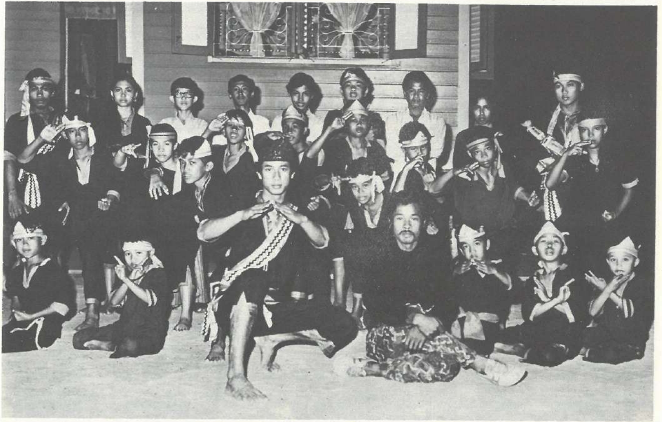
Sebahagian penuntut Silat B. K. M. S. telah lulus peringkat 11.