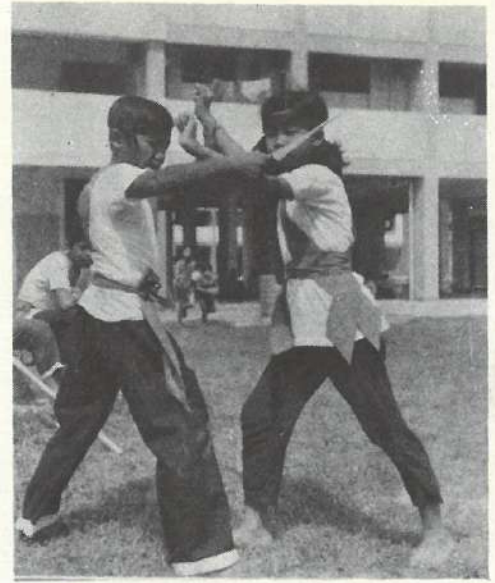
Seni Silat Gayong