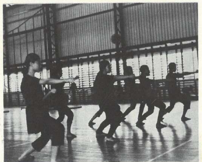
Seni Silat Gayong