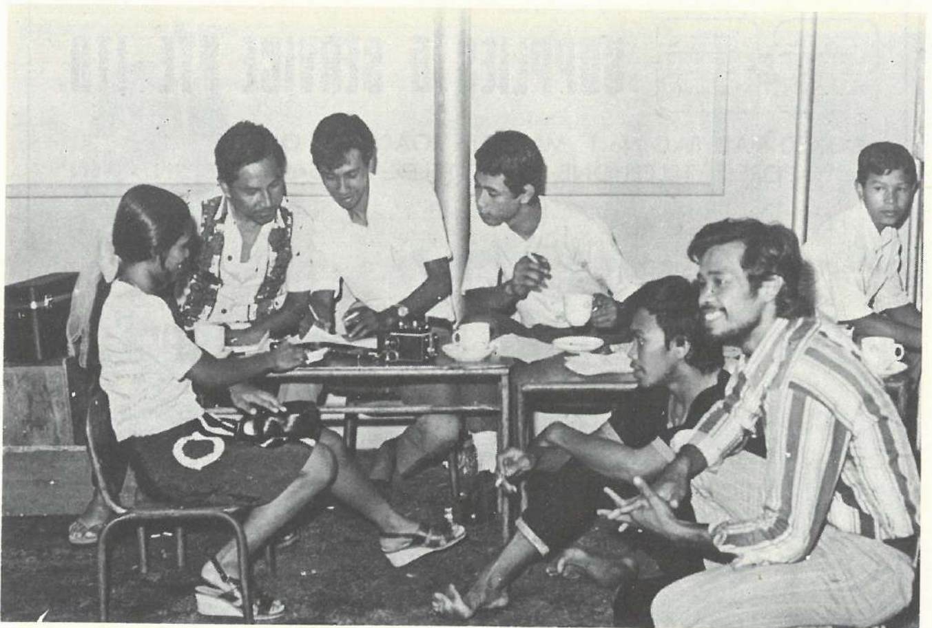
Pegawai2 Saksi Silat Sedang Merundingkan Masaalah Berhubong Dengan Kursus Silat.