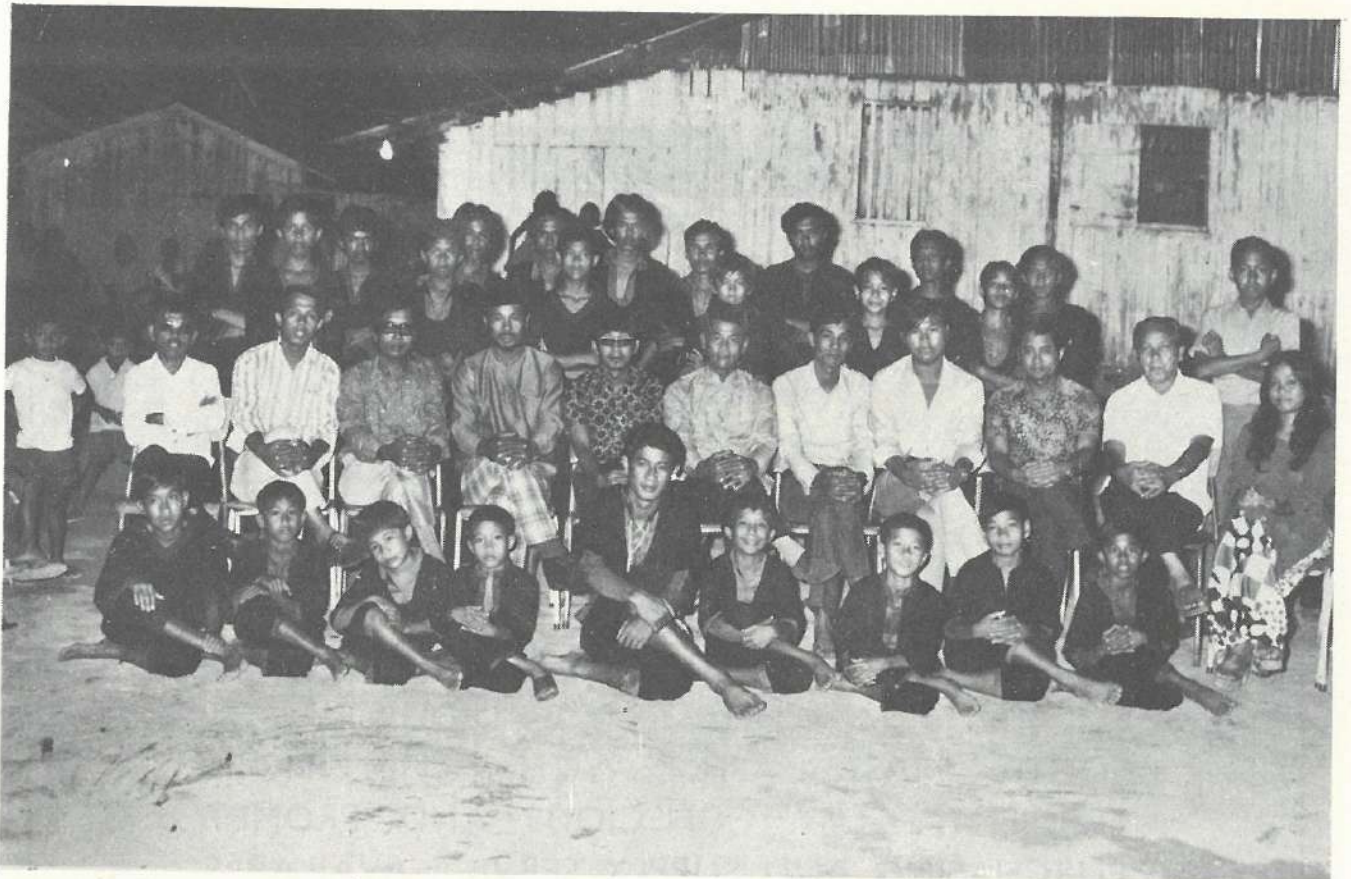
Sebahagian Pegawai2 BKMS Dengan Sebahagian Penuntut2 Di-Coronation Road.