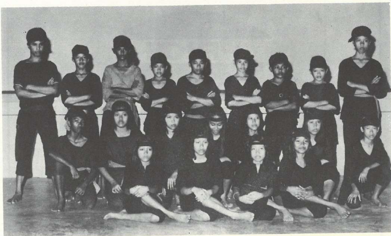
Sebahagian Dari Peserta Di-Peringkat Separoh Akhir.